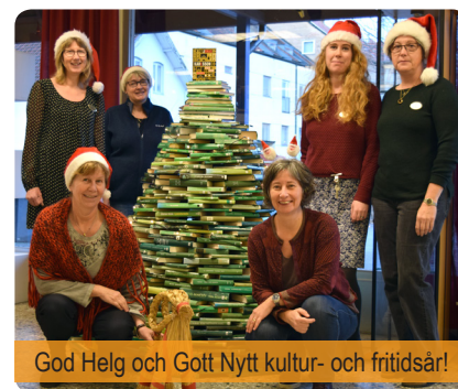
God Helg och Gott Nytt kultur- och fritidsår!

Till sist vill vi tacka alla fantastiska föreningar för allt arbete ni gör för kommunens invånare och besökare och för ett gott samarbete under året!