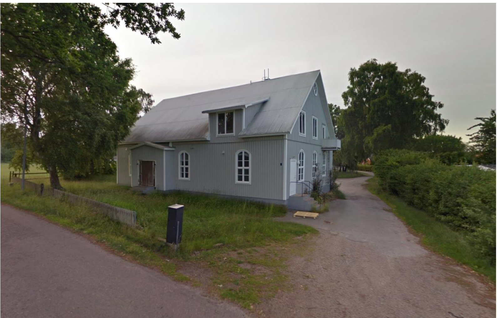
Planområdet, vy från Gummebovägen.