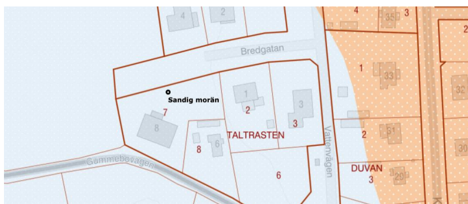
Utdrag ur SGU:s kartdatabas

Marken inom planområdet består enligt SGU:s geodatarkiv av sandig morän med ett ungefärligt djup på 5-10 meter. Berggrund i området utgörs av sandsten, konglomerat, siltsten, lerskiffer.