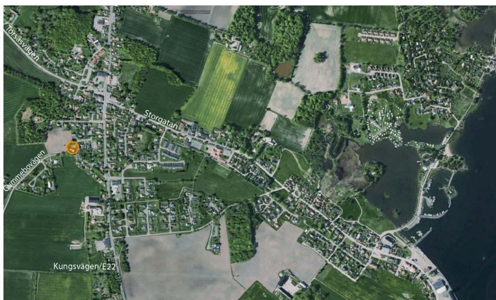
Översiktsbild med planområde markerat med orange cirkel