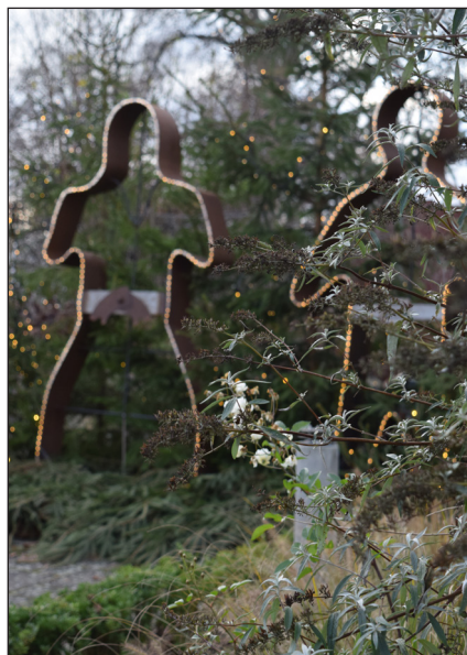
Ett stort tack till Torsås kommuns gata/park-avdelning som smyckar så vackert i kommunen.

Ett första planförslag har tagits fram och kommer att skickas ut för information och inhämtande av synpunkter i ett samråd. Ett covidanpassat sätt att samråda håller på att tas fram. För mer information se kommunens hemsida: www.torsas.se