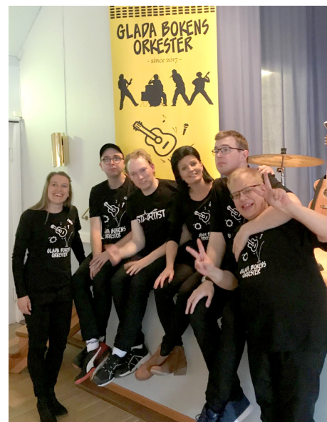
Glada Bokens Orkester - Ett glatt gäng som den 9 maj spelade och sjöng på Torsås Bygdgård. Samarbete mellan LSS och Kultur & fritid.