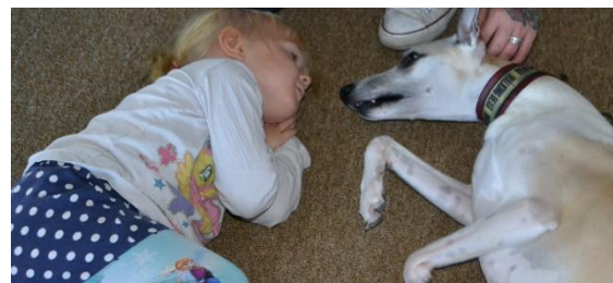
Sagostund för barn och hundar var ett roligt evenemang på höstlovet 2018.

Bibliotekets kulturaktiviteter för barn och unga ska genom olika uttrycksformer stimulera till kreativitet och fantasi. Lovprogrammen ska erbjuda aktiviteter för olika åldrar och intressen.