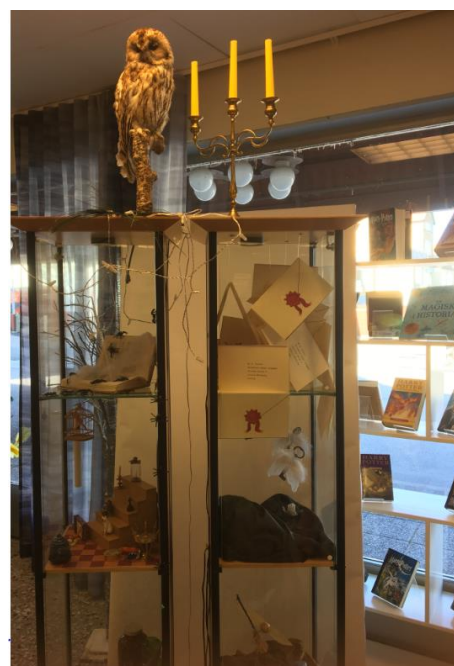
2019 är det 20 år sedan Harry Potter för första gången gavs ut på svenska – detta firade biblioteket med en familjedag.